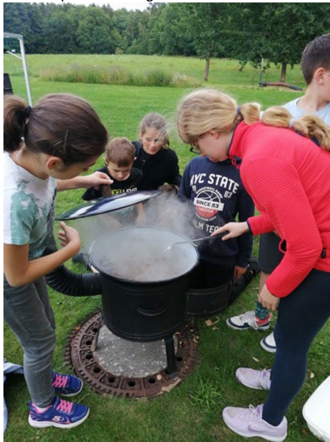
Gemeinsam auf dem Feuer kochen gehört zum Programm dazu.