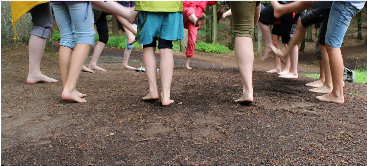
Gemeinsam den Naturpark und seine Besonderheiten erleben – beim Naturpark-Elemente-Sommercamp 2024.